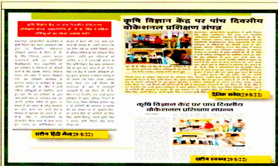
News Paper Cutting 29 Aug. 2022