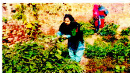
Nutri-garden at village-Katha, Baghat