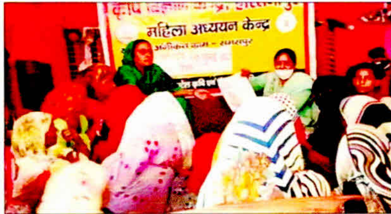
समसपुर गांव में महिलाओं को जानकारी देती केवीके कर्मचारी।