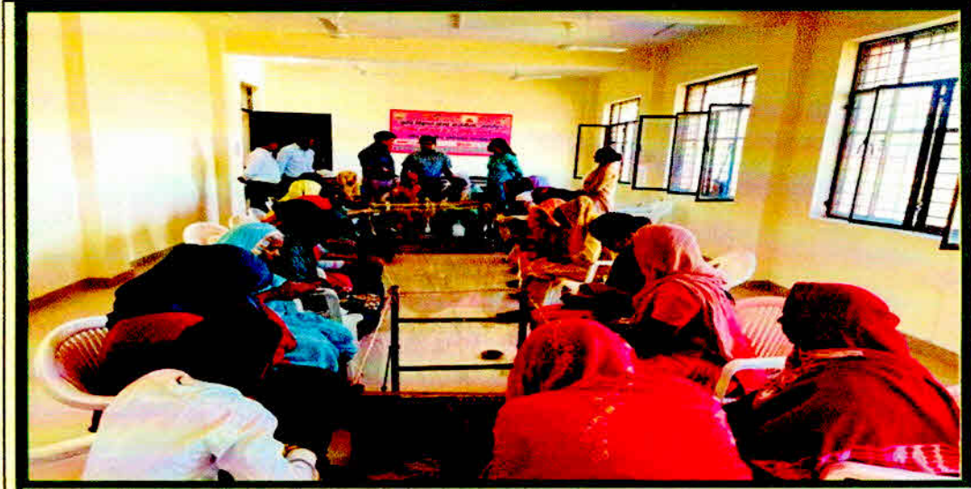
Skill Oriented Training for making lace (bell) of sarees and dupattas on 15-19 May 2023

40 five-day skill-based programs were organized, drawing 959 women