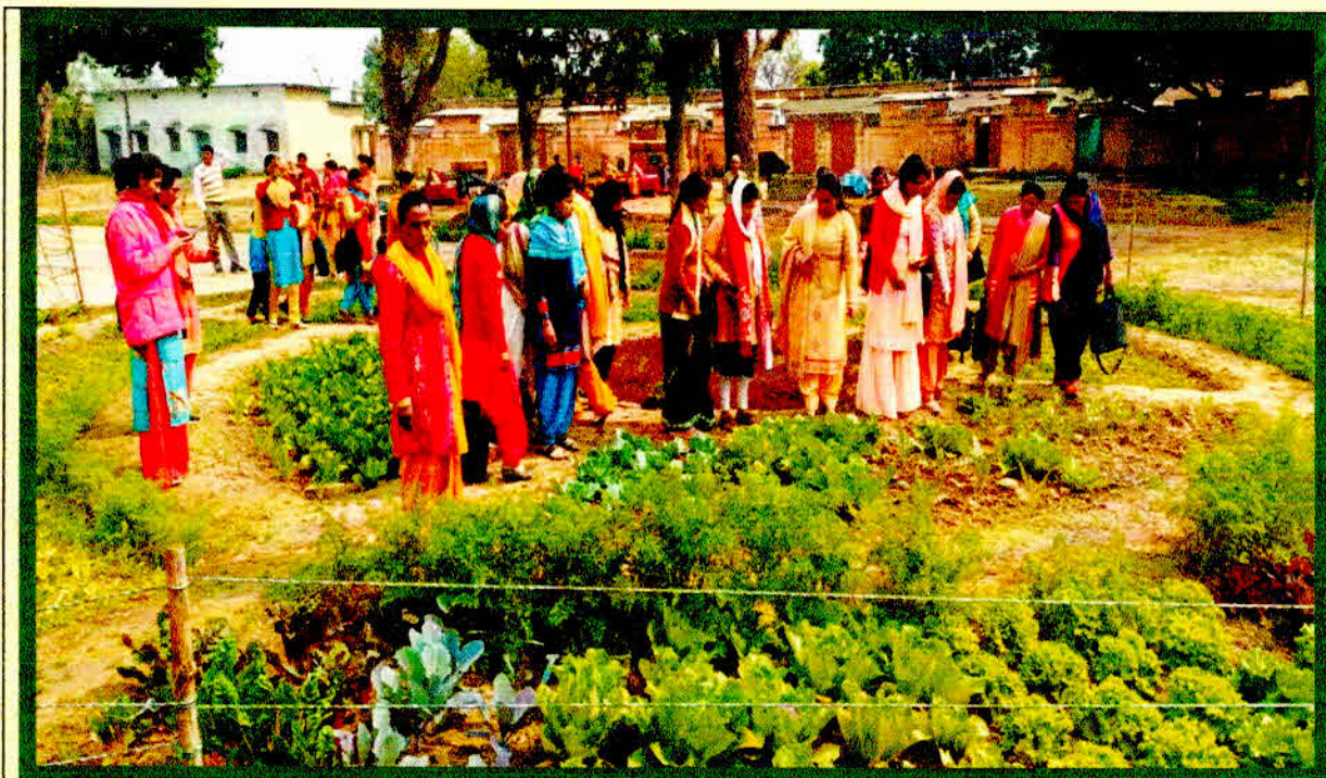
Women Farmers Visit Nutritional Garden on 09 Nov. 2022