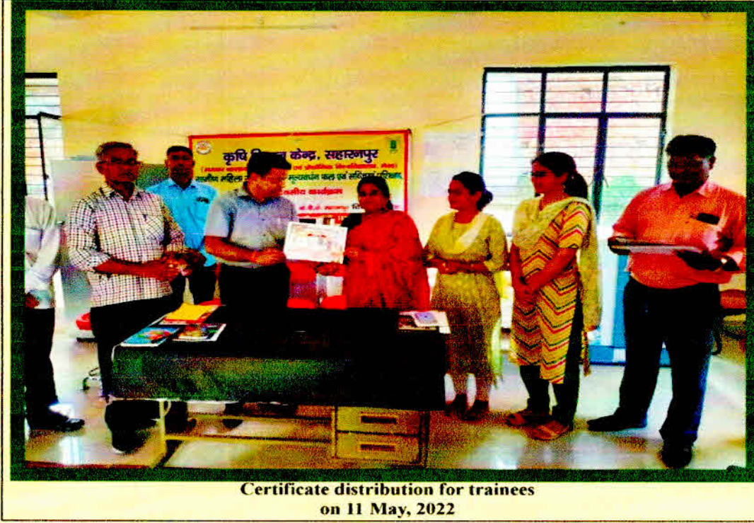
Certificate distribution for trainees on 11 May, 2022

@ कुलसचिव संवत् ०५० कृषि एवं पौध विज्ञान विद्यालय मेरठ-250110 (उ०प्र०) Anusha Dean College of PHT&FP SVPUAT, Meerut (UP)