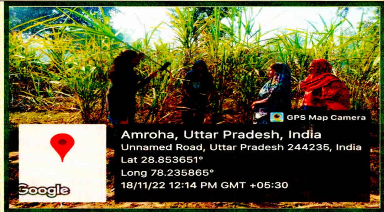
University scientist Demonstrating the use of Sugarcane stripper to Farm Women

Anurag Dean College of PHT&FP SVUAT, Meerut (UP)