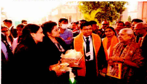
Hon'ble Governor interacts with group members