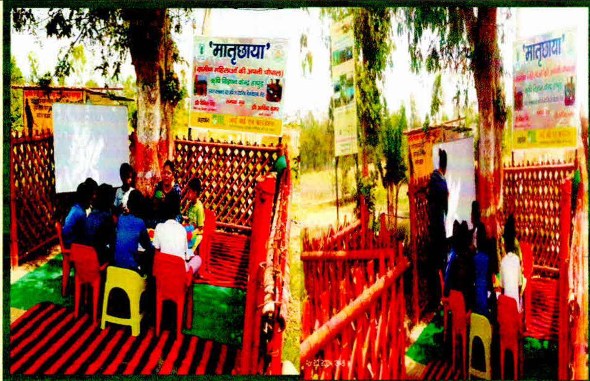
Innovative Unit ("MaatryaChhaya: Rural women Chaupal") under MahilaAdhyan Kendra on 25 Sept. 2023 at Hapur