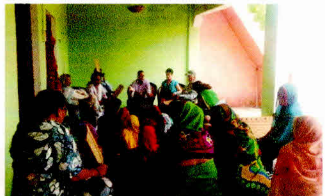
Group meeting with university scientist