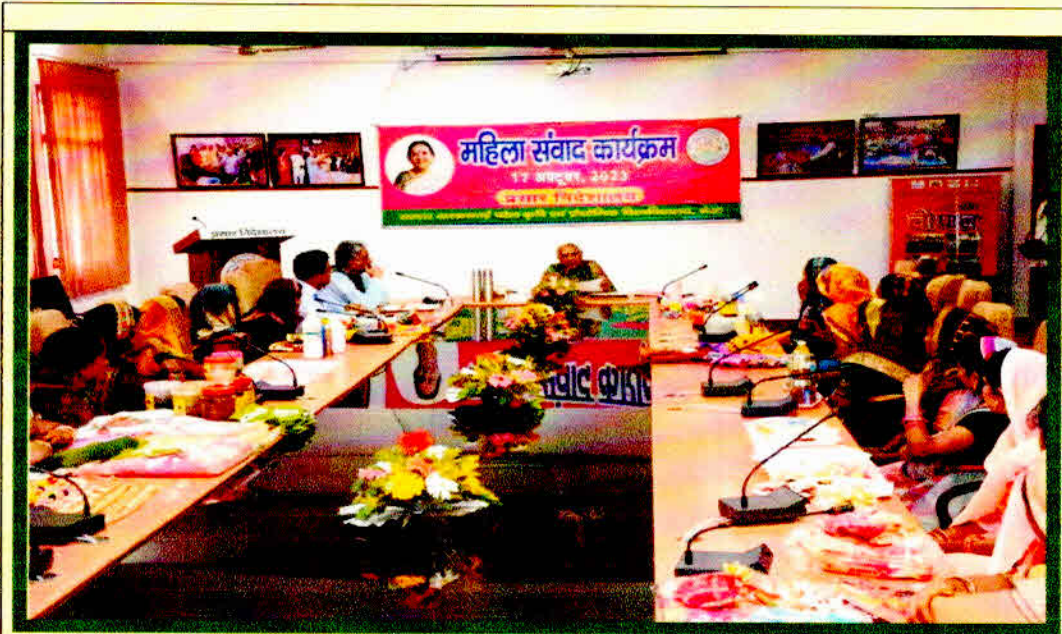
Hon'ble Governor interacts with Illiterate Women trainees at Kisan Mela on 17 Oct. 2023