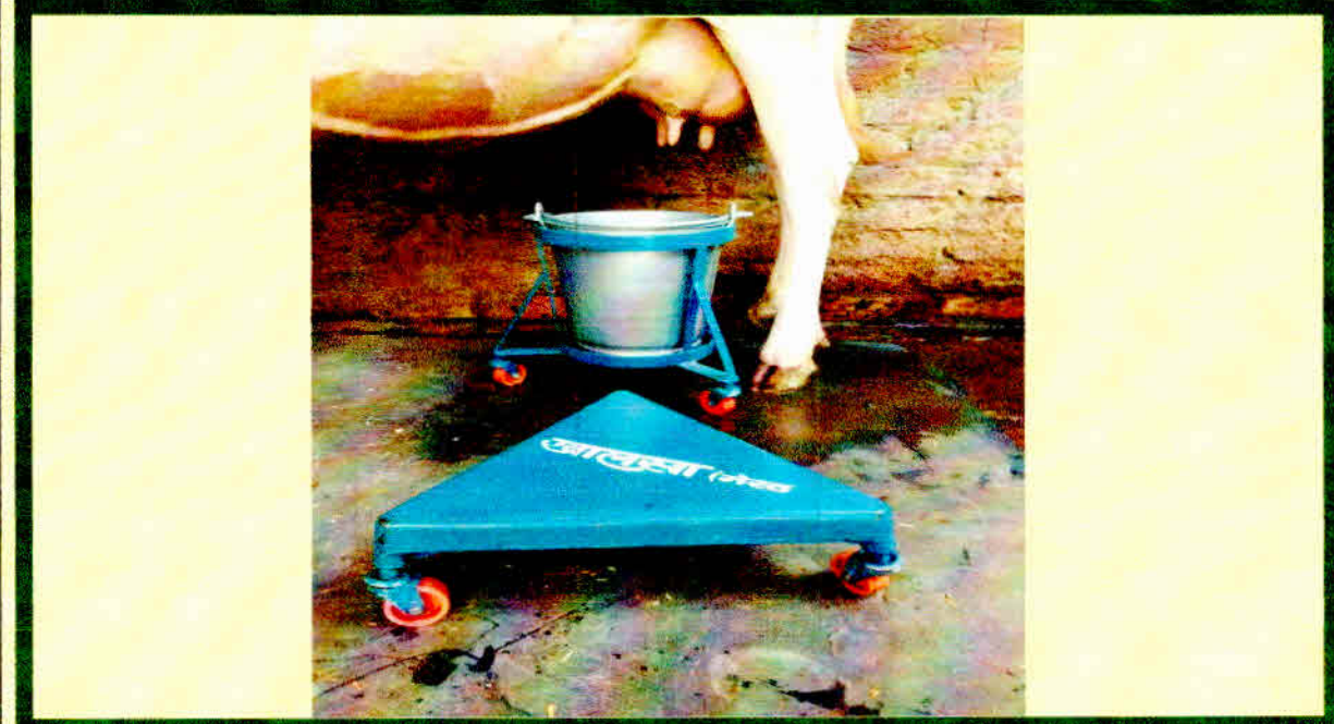
Revolving Stool - improved tool for milking