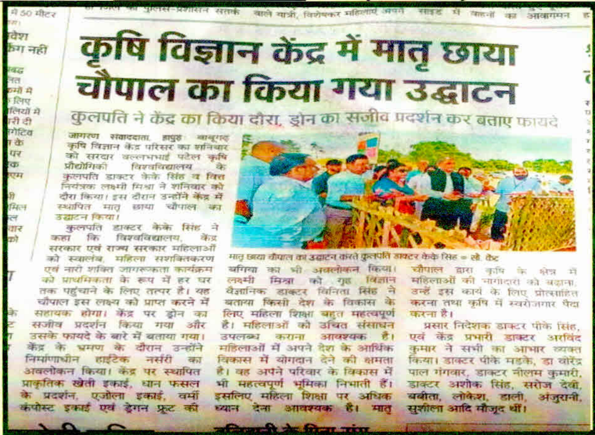
News Paper cutting of Inauguration - MaatryaChhaya: Rural women Chaupal 27 Aug. 2023