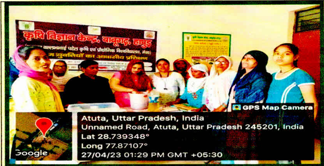
Skill Oriented Training for making health and hygiene products