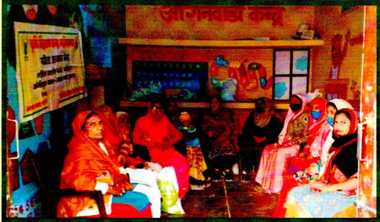
Awareness Programme Anganwadi Workers on National Energy Conservation Day On 14 Dec. 2021 at Dendna Village