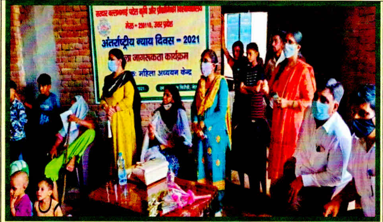
Awareness Programme on International Justice Day on 17 July 2021 at Chirodi Village