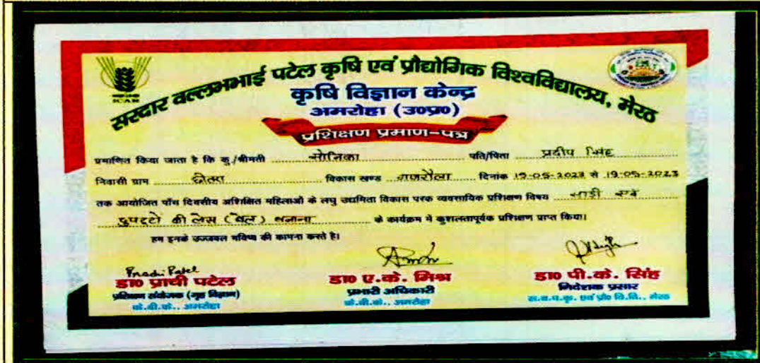
Certificate of Training for trainees on 15-19 2023