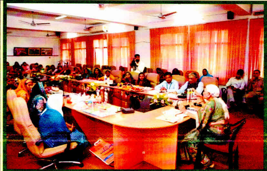
Hon'ble Governor interacts with Illiterate Women trainees at Kisan Mela on 17 Oct. 2023

Anand Kumar Dean College of PHT&FP SVPUAT, Meerut (UP)