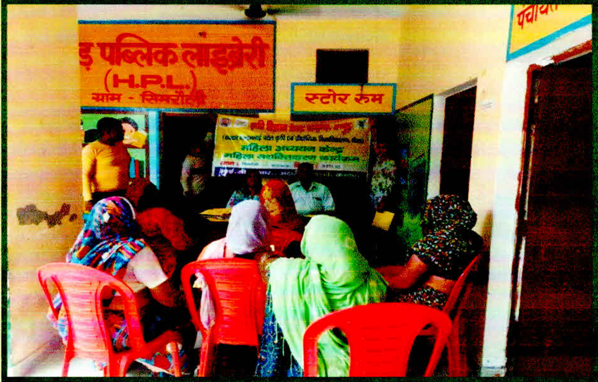
Awareness Programme on Govt. Schemes on 09 Aug. 2023 at Simroli Village